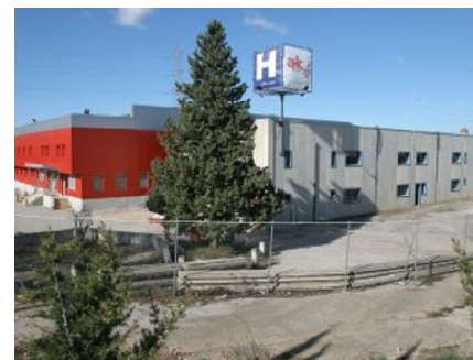
La residencia, con plaza para 250 universitarios, cerró en el curso 2008-2009.

El establecimiento prevé abrir sus puertas durante este mes, según anuncia en su página web